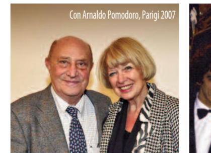
Con Arnaldo Pomodoro, Parigi 2007