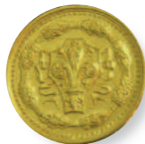
1993, "Fiorino della Città di Firenze"