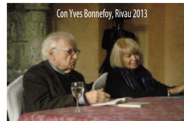
Con Yves Bonnefoy, Rivau 2013