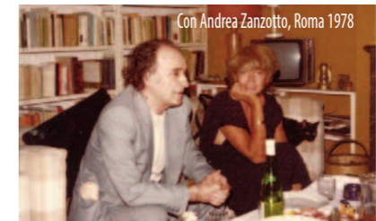
Con Andrea Zanzotto, Roma 1978