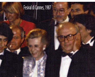
Festival di Cannes, 1987